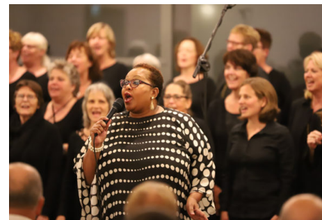
Cultuuranker Leidschenveen -Ypenburg