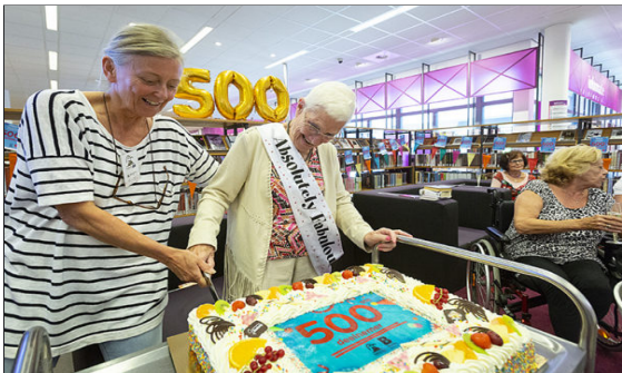
Project Ouderen in de Wijk

In debat met minister-president Mark Rutte, herinneringen delen en vastleggen bij Verhalentafels of een workshop gospel zingen: inwoners van Den Haag ontmoetten elkaar in de bibliotheken, gingen in debat, praatten over herinneringen aan vroeger en leerden nieuwe dingen op het gebied van cultuur. Enkele hoogtepunten vindt u hier.