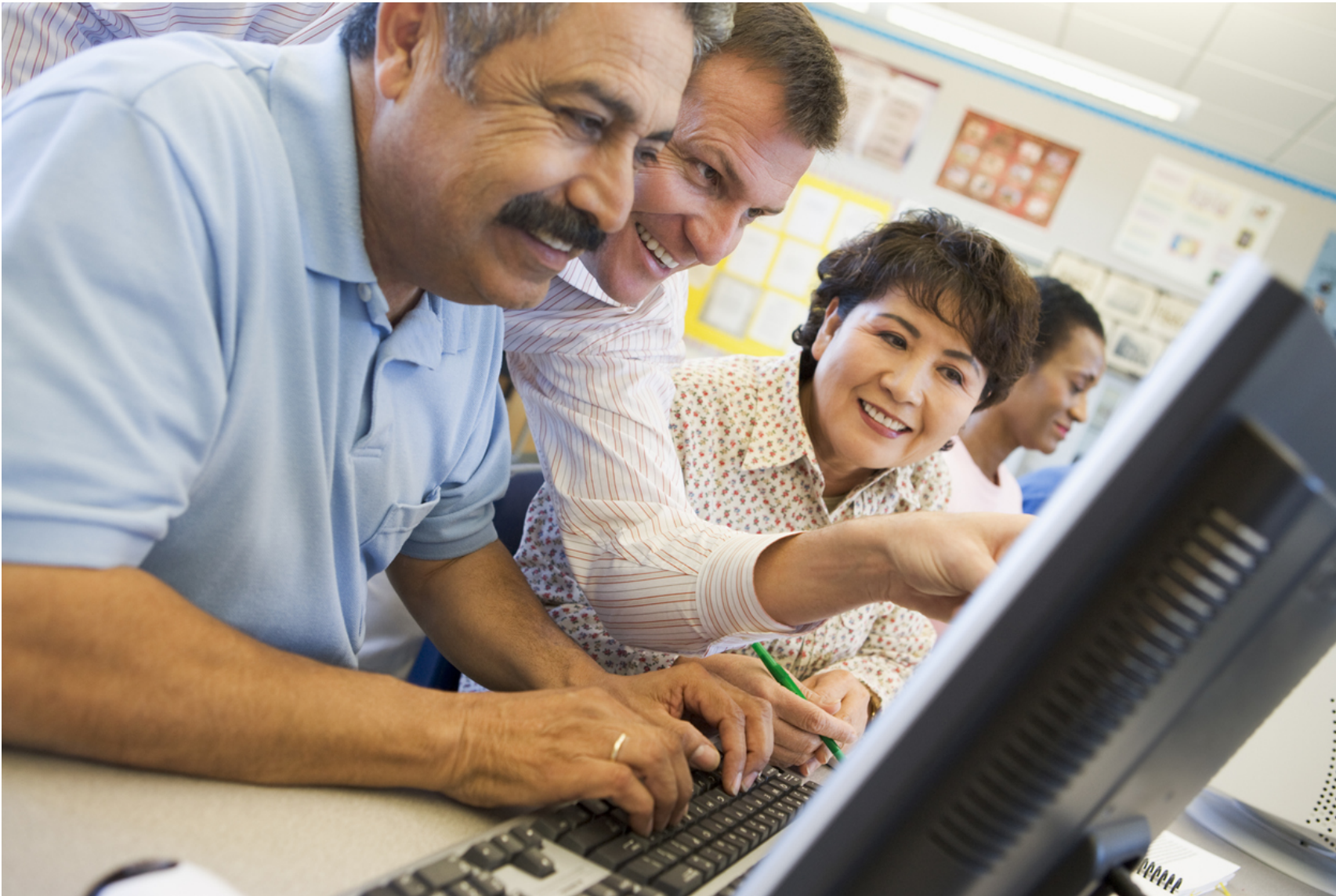
Mature students learning computer skills in classroom