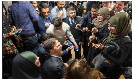
Politiek in de Schilderswijk