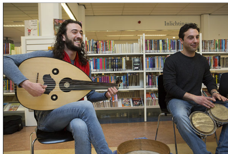
Cultuuranker Loosduinen - Nieuw Waldeck